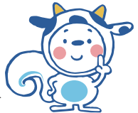
マスコットキャラクター りすもん